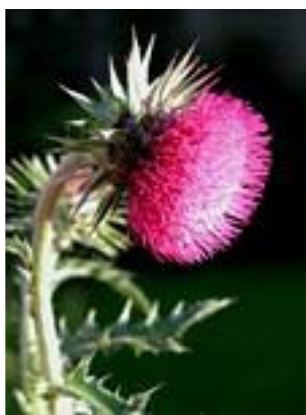
Nicktistel ( Carduus nutans )

Under tre dagar fascinerades vi och njöt av den säregna naturen på Fårö. Totalt cyklade vi ca 11 mil på ön i strålände solsken och frisk NO-vind. Vid de gamla gråa fiskebodarna, Helgumannen, drack vi vårt medhavda kaffe i lä för vinden och längre norrut i naturreservatet Langshammar beundrade vi raukarna. Marken täcktes av rödlysande backtimjan och längs vägen blommade blåeld, cikoria, nicktistel, orkideer och pukvete.